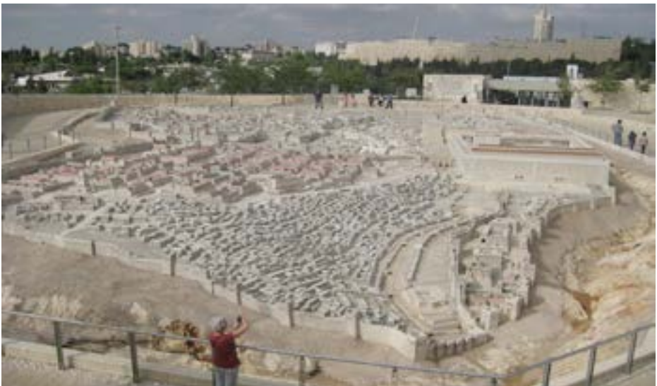
Modell av Jerusalem baserad på arkeologiska fynd.

och själv bli avsatt av kejsaren eller låta judarna få sin vilja igenom och behålla sin ställning som landshövding. Pilatus satte sig i domarstolen för att avge domen. Han förde fram Jesus inför folket och sa, "Här ser ni er konung!" Varpå översteprästerna ropade: "Vi har ingen annan konung än kejsaren" (Joh 19:15). Han måste ha stelnat när han hörde judarna kalla kejsaren för sin kung. Nu visste han att slaget var förlorat. Pilatus bad om vatten och tvådde sina händer i ett sista försök att lägga ansvaret på judarna. Denna handling är nog det som Pilatus är mest känd för. Därefter utlämnade han Jesus till att korsfästas. □