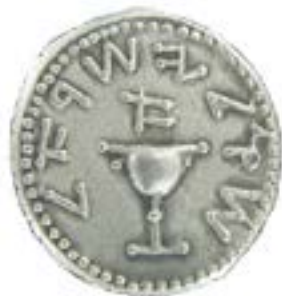
Shekel från Tyrus i Fenicien. Mynt som detta präglades från 129 f.Kr till 66 e.Kr.