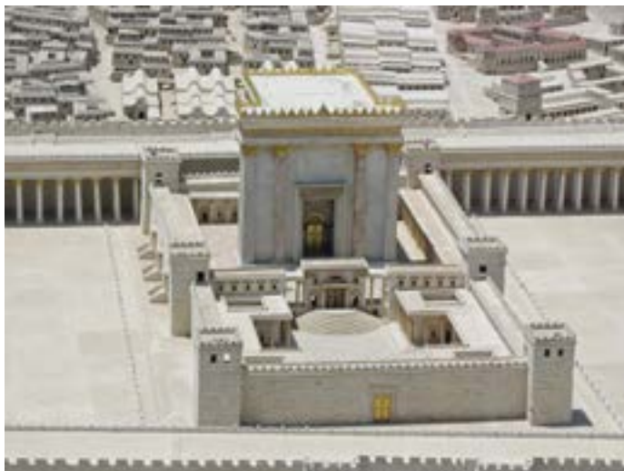
Modell av templet på Jesu tid.

När också detta försök att frige Jesus misslyckats försökte Pilatus med en kompromiss. Trots att han visste att anklagelserna mot Jesus var falska föreslog han att Jesus skulle gisslas och därefter sättas på fri fot (Luk 23:16). Medan