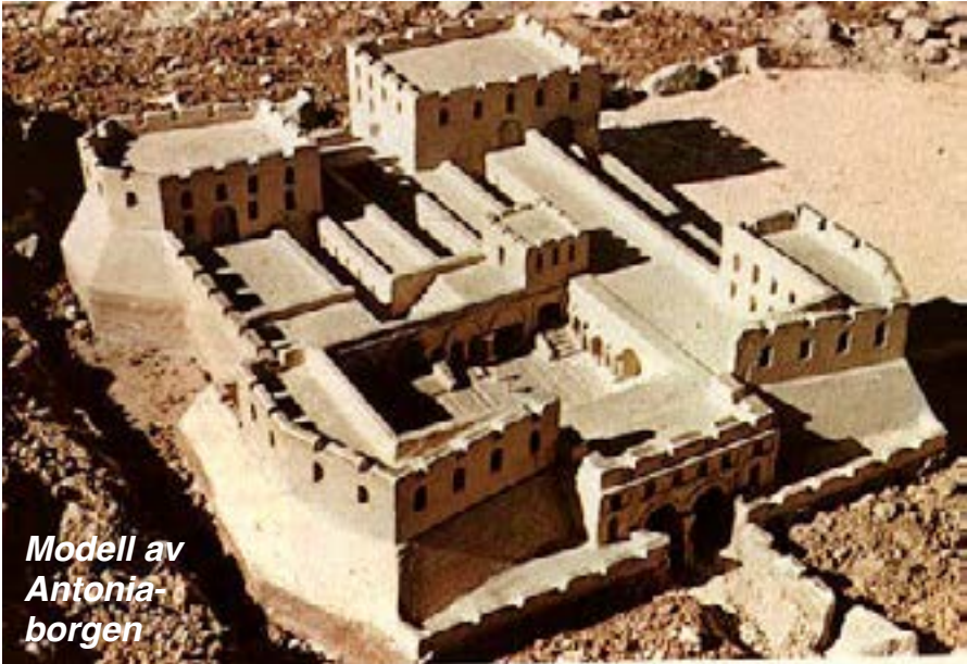
Modell av Antonia- borgen

bredvid templet . Det var vaktskifte flera gånger per natt och trumpeten man använde 03:00 kallades på latin för "gallicinium" vilket betyder "tuppgållen".