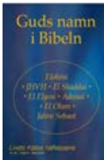
Livets Källa nr. 39

Jesus fortsätter med att ta upp vår relation till honom och säger,